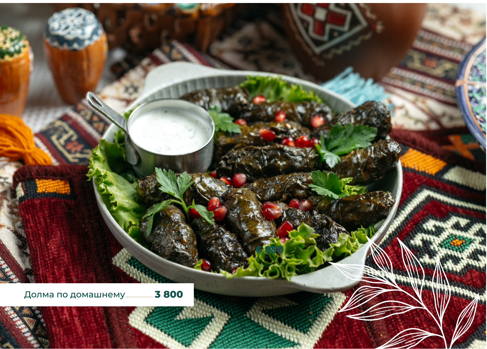
Долма по домашнему.....