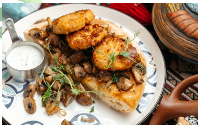
Котлетки из рубленого цыпленка с жареными вешенками на кукурузной лепешке..... 2 700