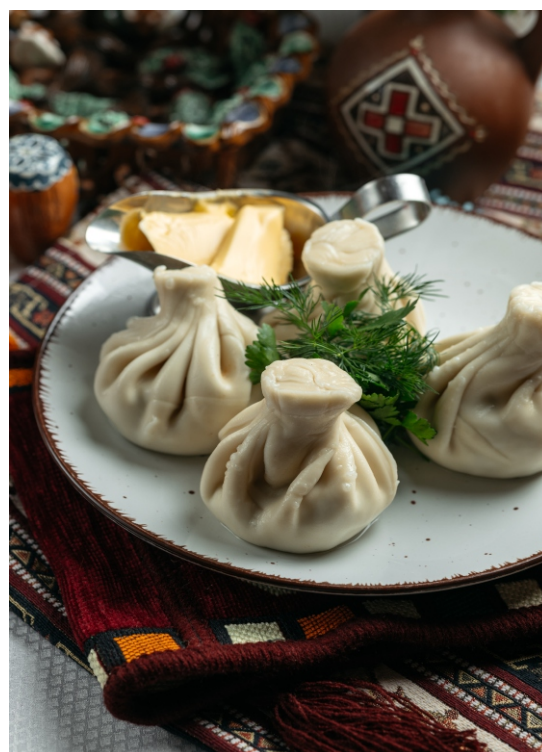
Хинкали с говядиной..... 3 300