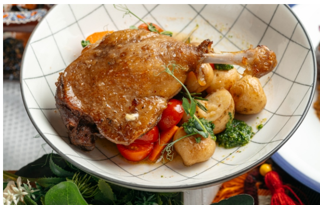
Жаркое из утки..... 6 600