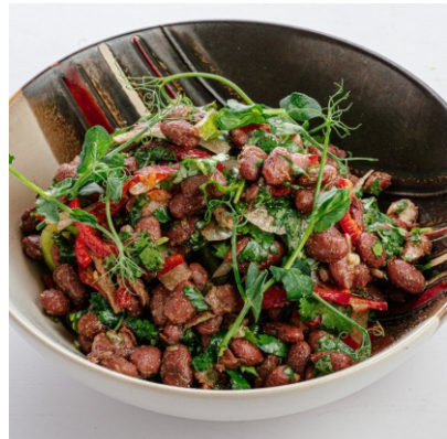
Салат Тбилиско..... 3 200