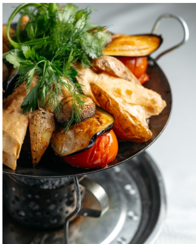
Садж по-Азербайджански на 3 персоны..... 12 000