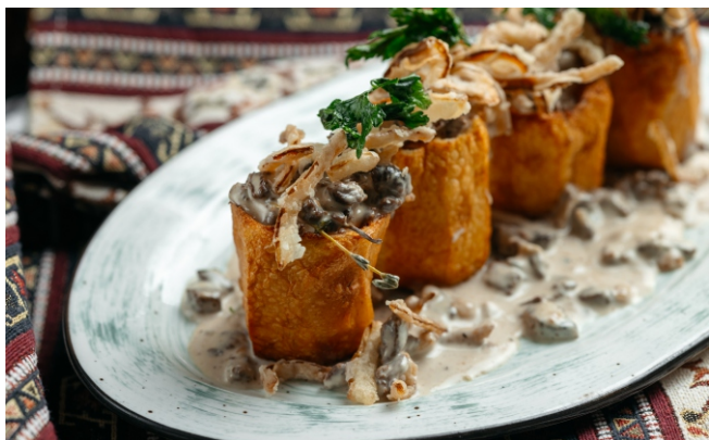
Картофельные бочонки томленой кониной и луковыми чипсами.....