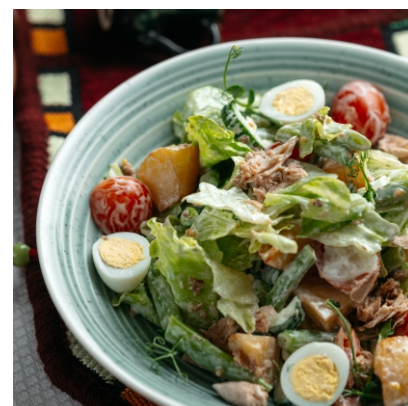
Салат из консервированного тунца с молодым картофелем и перепелиным яйцом..... 3 750