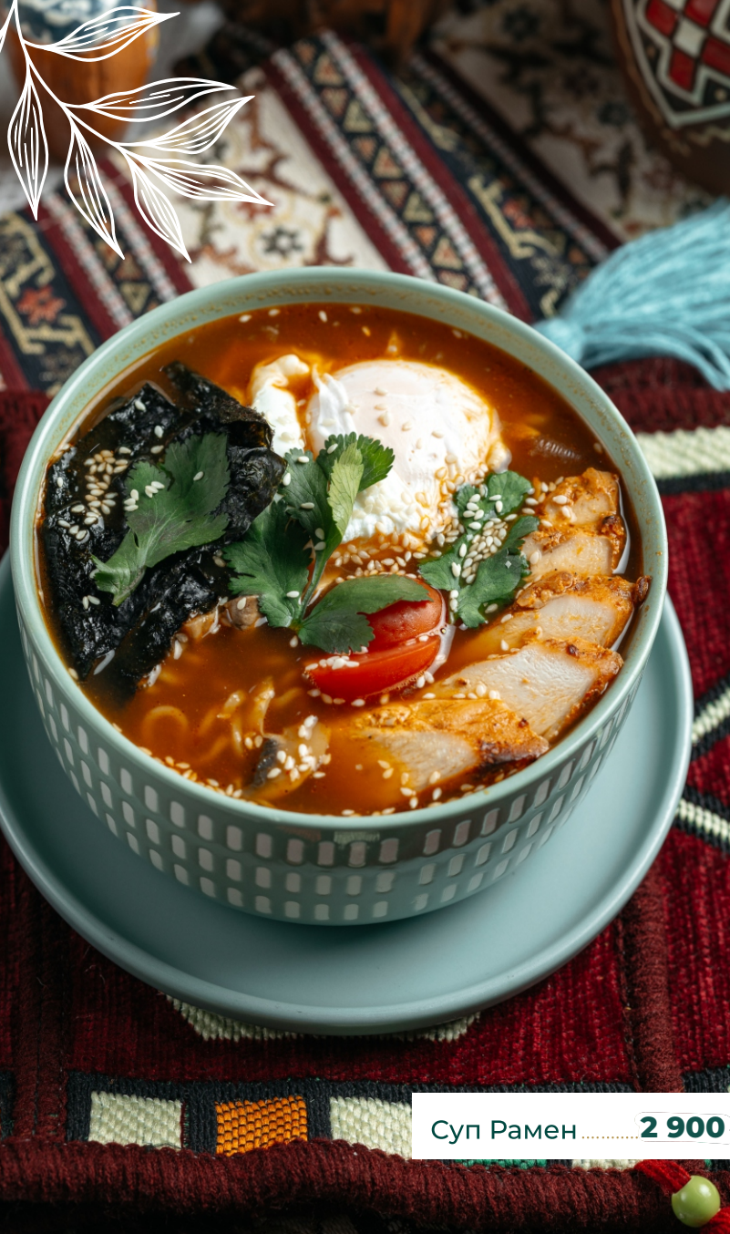
Суп Рамен ..... 2 900