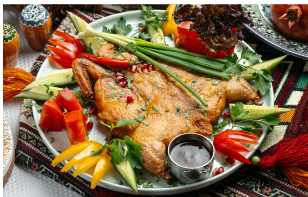
Цыпленок табака..... 3 800