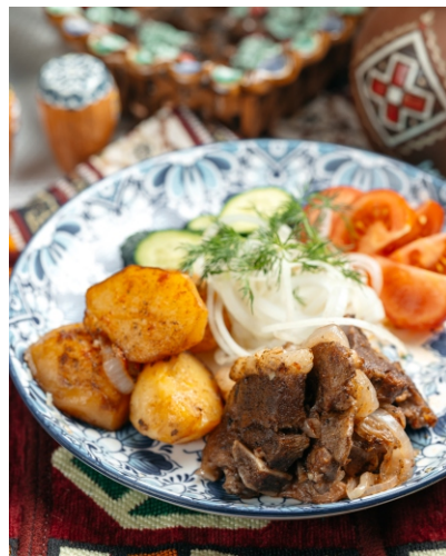
Казан кебаб из баранины..... 4 500