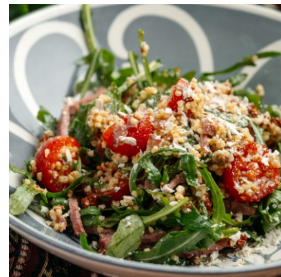
Салат с тары и копченой кониной..... 4 200