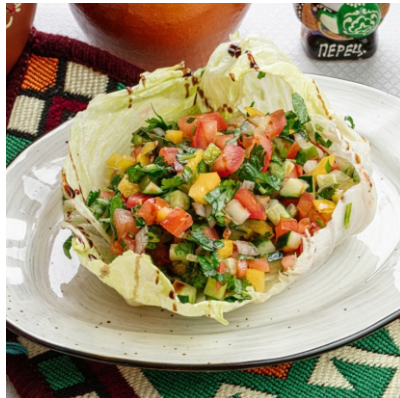
Салат Витаминный..... 2 950