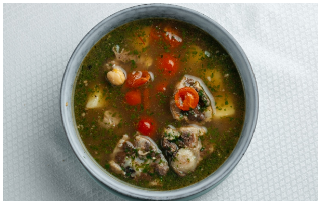
Суп «Мужская сила»..... 2 800