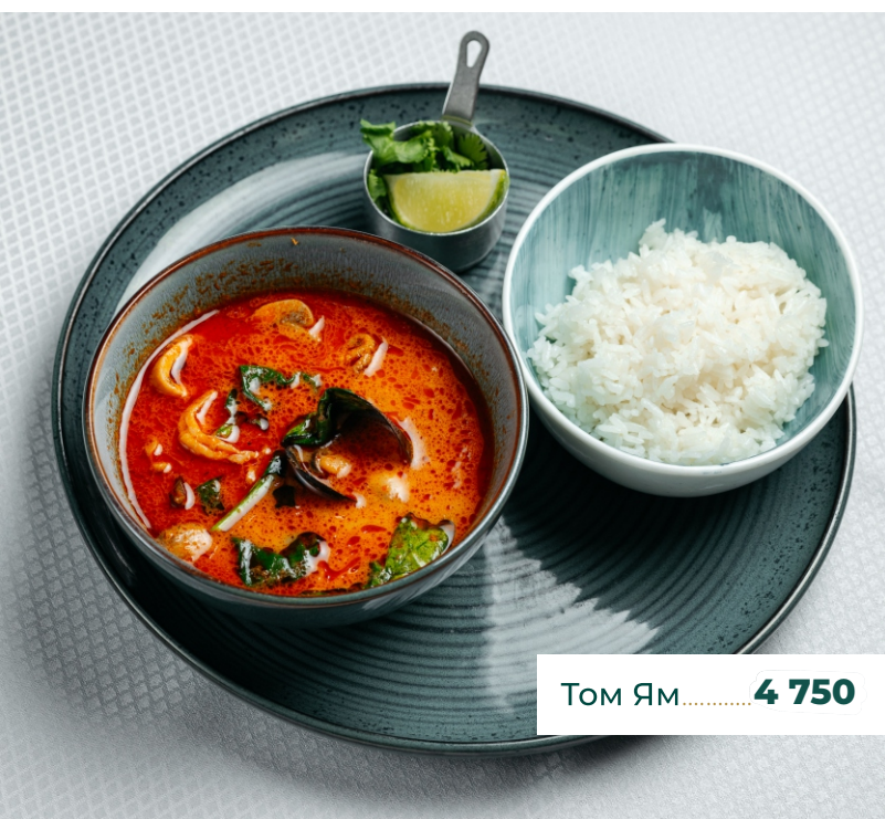
Том Ям..... 4 750