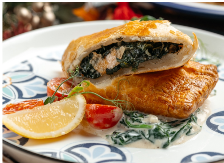
Лосось в слоеном тесте с зеленью со сливочно-шпинатным соусом..... 6 300