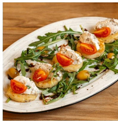
Тминные лепешки с копченой скумбрией..... 3 750