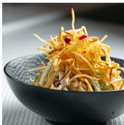
Салат с цыплёнком, яблоком и картофелем пай..... 2 800