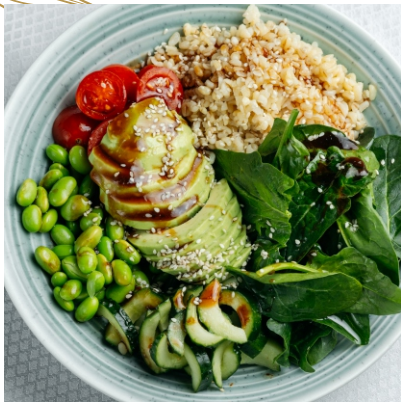
Болл салат с авакато и булгуром..... 3 200