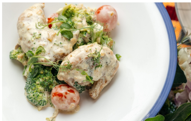
Цыпленок в сметане по-Кавказки..... 3 800