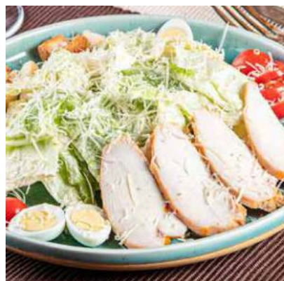
Салат Цезарь с курицей..... 3 800