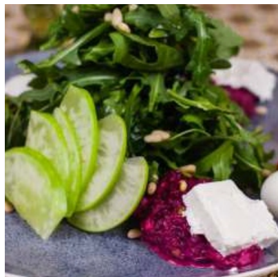
Салатс сыром салакис..... 3 800