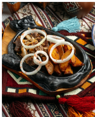
Жар-Бар по-Восточному..... 3 300