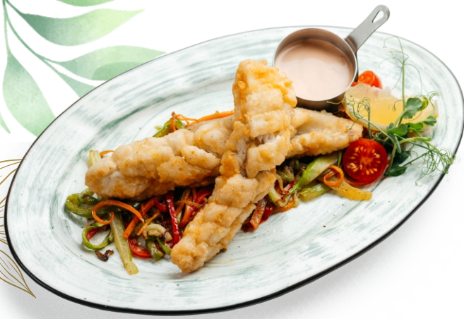
Хрустящий судак с апельсиновым соусом на подушке из сезонных овощей..... 3 200