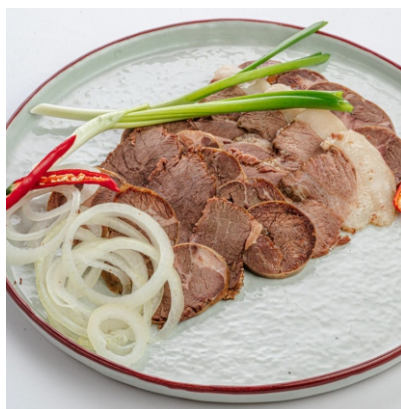
Конское ассорти 6 200