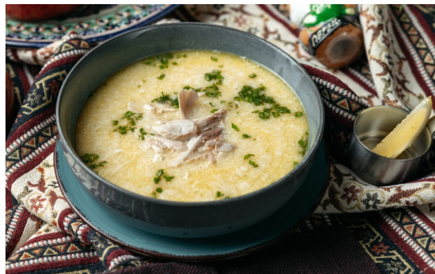
Суп куриный «Похмельный»..... 2 300