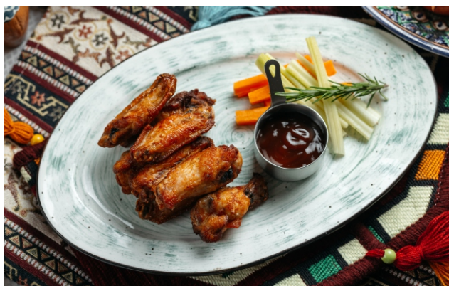
Крылышки Баффало..... 2 900