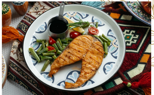
Стейк из семги (на гриле)..... 6 200