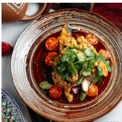
Салат Бадридждани с брынзой..... 2 800