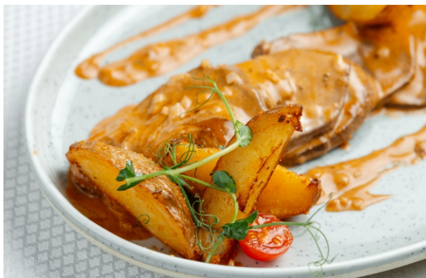
Томленный телячий язык в красном вине, с соусом из сельдерея и молодым картофелем.....