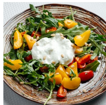
Салат с консервированным персиком и Страчетеллой..... 4 900