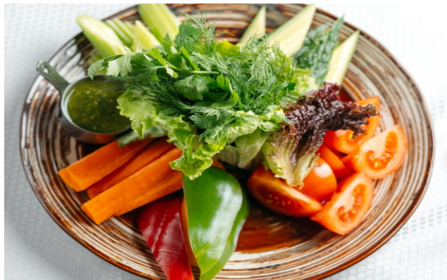
Овощная грядка (помидоры, морковь, стебель сельдерея, перец светофор, огурцы, микс из зелени, брынза)..... 3 850