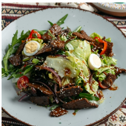
Теплый салат с кониной..... 3 950