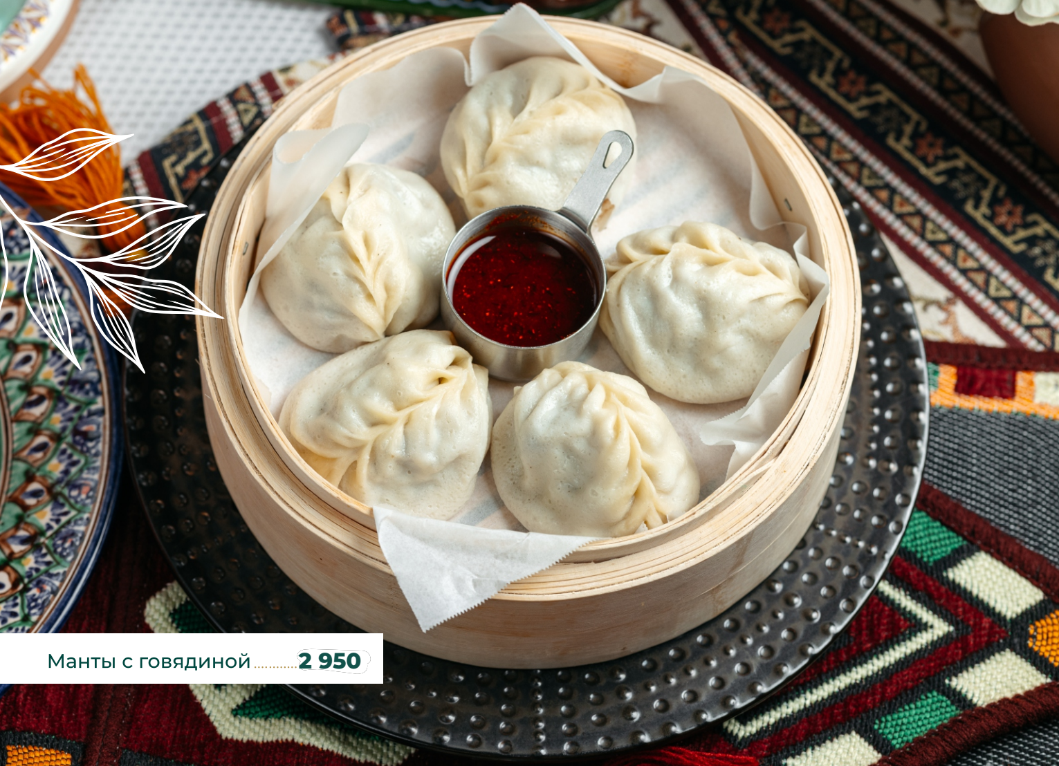
Манты с говядиной..... 2 950