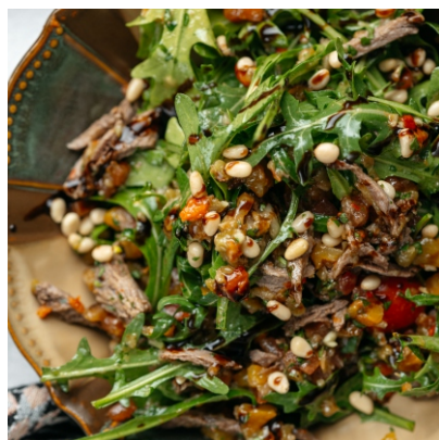
Салат с запеченными овощами и ростбифом..... 4 850