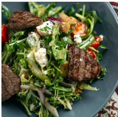
Стейк салат с телятиной, грибами и сыром блю чиз..... 4 700