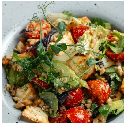
Салат с брынзой, зеленью и орехами..... 2 200