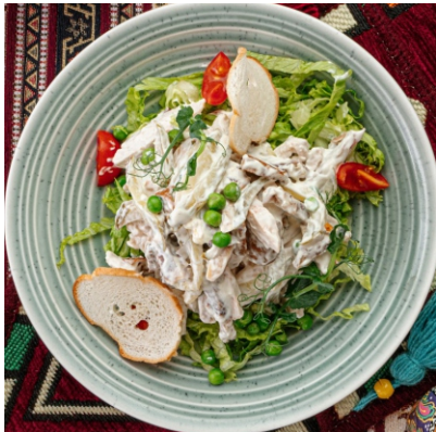
Салат Самарканд..... 3 200