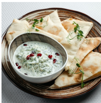
Цацыки с йогуртом..... 2 200