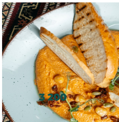
Хумус с запеченым болгарским перцем и вялеными томатами..... 2 500