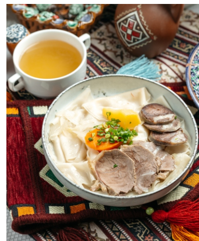
Бешбармак из конины..... 4 200