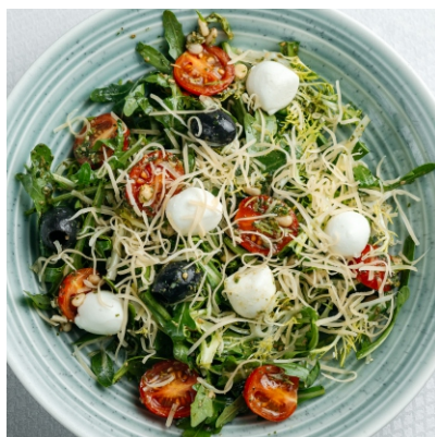
Салат с Мини моцареллой и соусом Песто..... 3 700