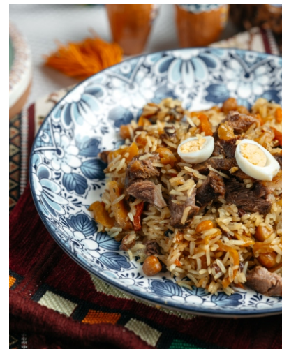
Плов Туй Оши по Ташкентски..... 3 390