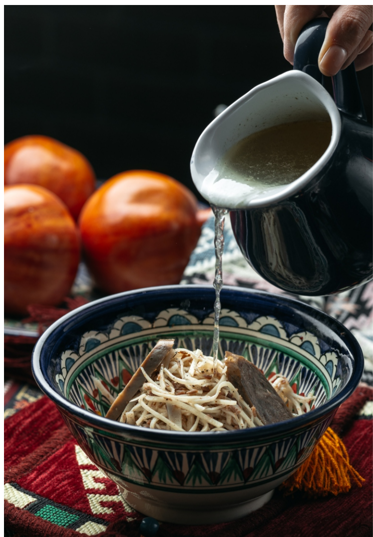
Нарын с бульоном..... 2 800