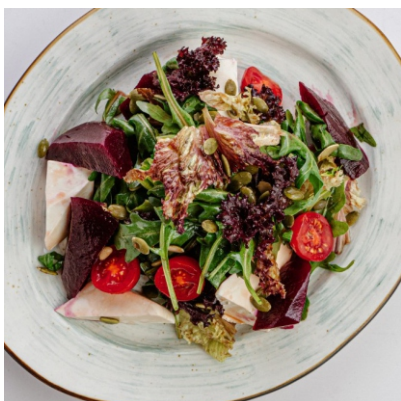
Салат с тыквенными семечками..... 2 800