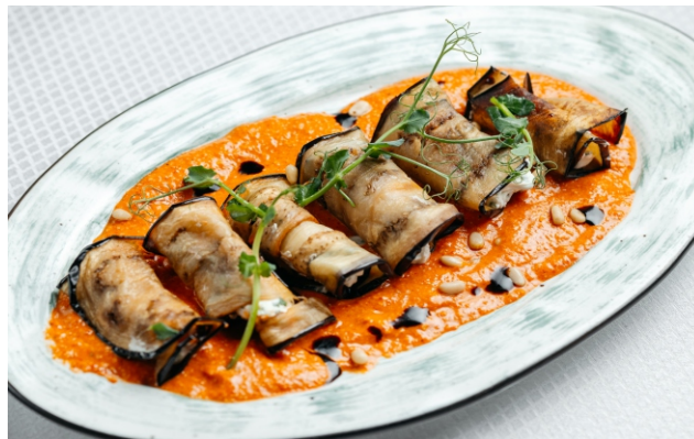
Рулетики из баклажанов с творожным сыром с соусом из запеченных перцев и орехами..... 3 200