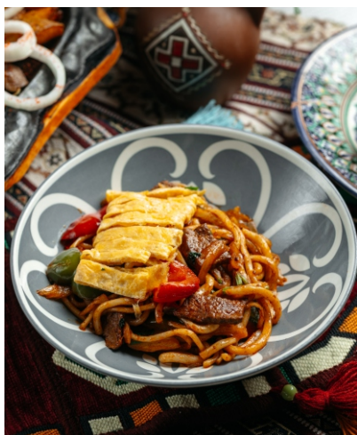
Коурма лагман..... 2 800