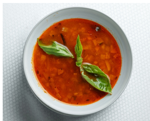
Пряный овощной суп из конины..... 2 900