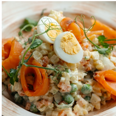
Салат оливье с копченой семгой и свежими огурчиками..... 3 200