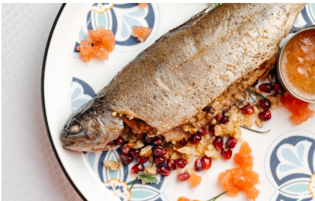
Форель по-Королевски..... 4 500